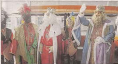
▲ Son Espases. Al Hospital de Son Espases llegaron en tren y después acudieron a algunas de las habitaciones del centro.