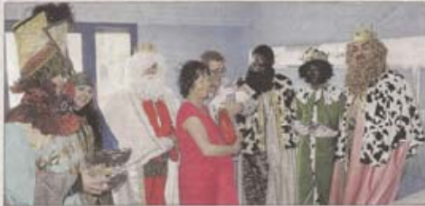
▲ Inca. En Inca visitaron el hospital. En una de las habitaciones estuvieron con un niño recién nacido.