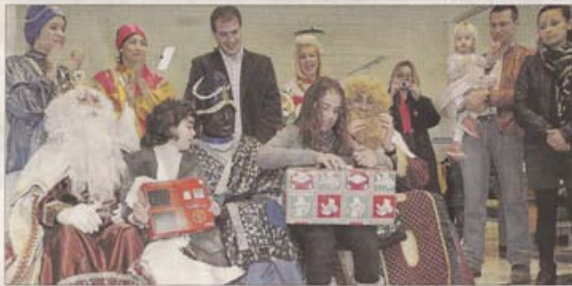
▲ Son Llätzer. Los juguetes también fueron entregados en Son Llätzer ante los aplausos de familiares de los niños y de miembros de la comitiva que acompañó a Sus Majestades.