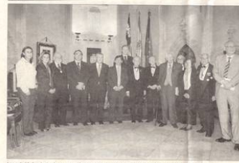
Las actividades, junto al nuevo académico e invitado, en la sede de la Academia de Medicina.