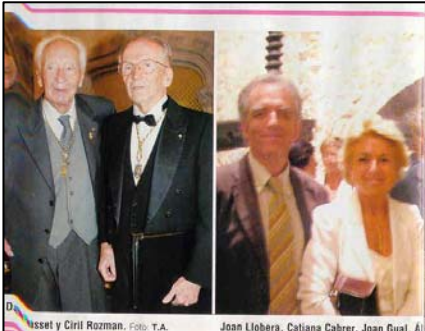
Dausset y Ciril Rozman.